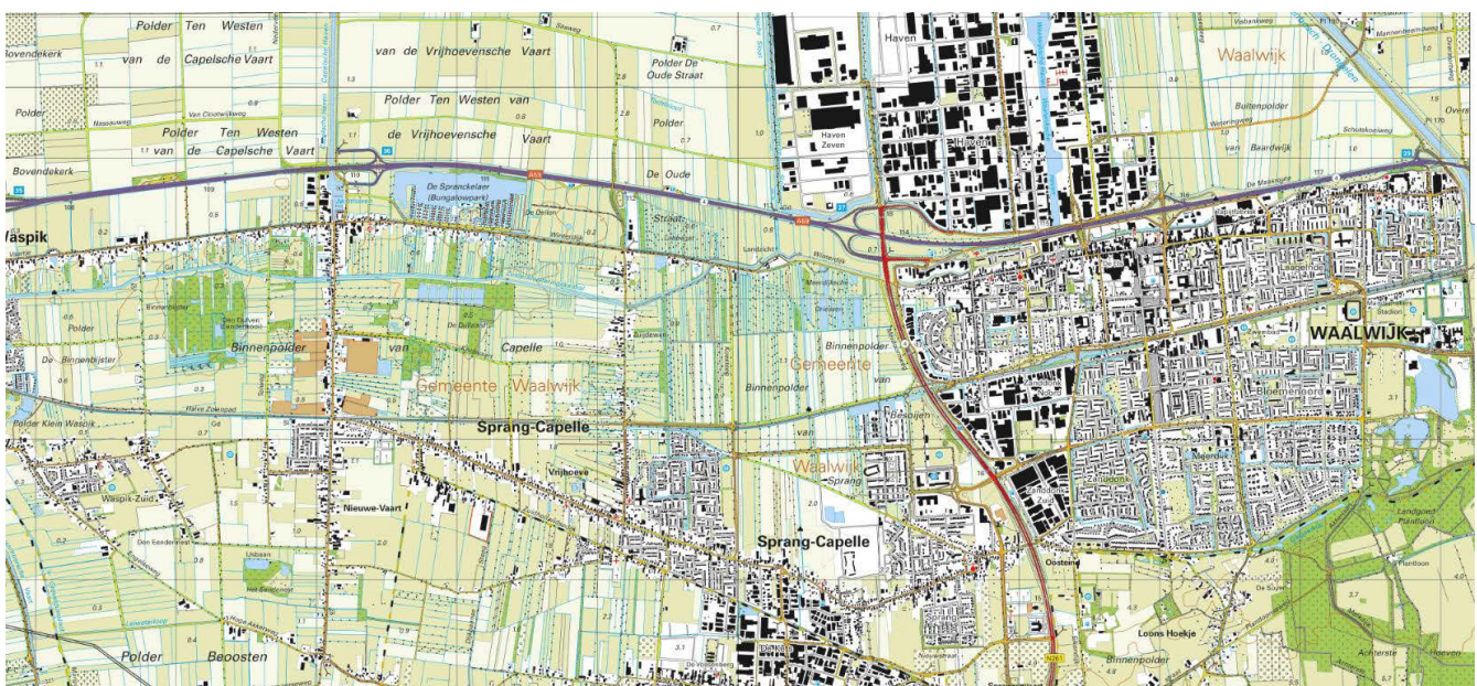
Sprang en omgeving 2016, bron: www.topotijdreis.nl

De grootste waren Heusden-Vlijmen en Z.A.K. (Zuiderafwateringskanaal)-Beneden-Donge. Die laatste betrof voor een groot deel een tweede ruilverkaveling in het gebied. De herkenbaarheid van het landschap is met de uitvoering van deze projecten flink verminderd. De oude strokenverkaveling is verdwenen en heeft plaatsgemaakt voor een veel grootschaligere blokverkaveling. Kleine delen zijn gespaard gebleven, onder meer ten noordwesten van Waspik en delen rondom 's Gravenmoer. Tussen Waspik en Waalwijk is het natuurgebied De Langstraat aangewezen als Natura 2000-gebied. Een ander Natura 2000-gebied ligt westelijk van 's-Hertogenbosch (Vlijmens Ven, Moerputten en Bossche Broek).