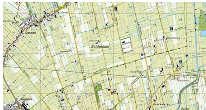
Tolbert e.o. rond 1940, 1983 en 2016

uit grasland bestaat. Vanaf 1950 vonden in het Westerkwartier op diverse plaatsen forse ingrepen plaats. De grootste was het Raamwerk Zuidelijk Westerkwartier, een ruim 22.000 hectare grote ingreep met een eigen wettelijke status. Sloten werden gedempt, hoogtes geëgaliseerd en houtwallen geslecht. Daarnaast zijn enkele kleinere ruilverkavelingen uitgevoerd.