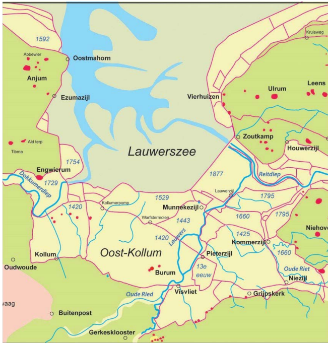
De inpolderingen van de Lauwerszee.